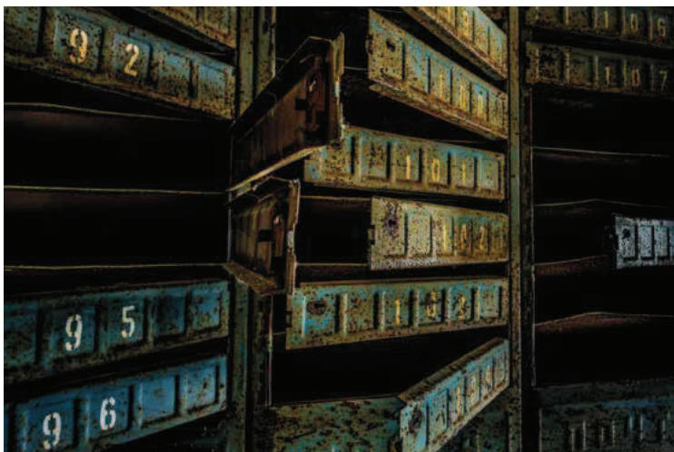
◀ Poštovní schránky opuštěné výškové budovy v Pripjati... Co víc dodat? 21. února 2020 11:10, Pripjať, Ukrajina Nikon Z7, Z 24 mm f/1,8 S, 4 s, f/10, ISO 800, stativ Befree GT XPRO Carbon, takřka neznatelné barevné tóny zvýrazněné pomocí Luminaru 4