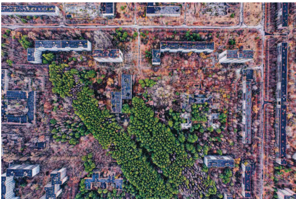
△ Letecký pohled na „město duchů“ Pripjať je možná přeci jen ještě o něco děsivější než pohled ze země. I zde se letos odehrály lehké novinky – dron DJI Mavic 2 Pro je sice stále aktuálním modelem již od září 2018, změna ale nastala v jeho nových bateriích. Pořídíte-li si totiž baterie z řady Enterprise, budou se vám před odletem samy ohřívat, a to za cenu 10 % jejich kapacity. Malá vychytávka pro lidstvo, velká pro dronistu.