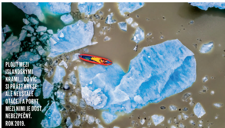
PLOUT MEZI ISLANDSKÝMI KRÁMI... CO VÍC SI PŘÁT? KRY SE ALE NEUSTÁLE OTÁČEJÍ A POBYT MEZI NIMI JE DOST NEBEZPEČNÝ. ROK 2019.