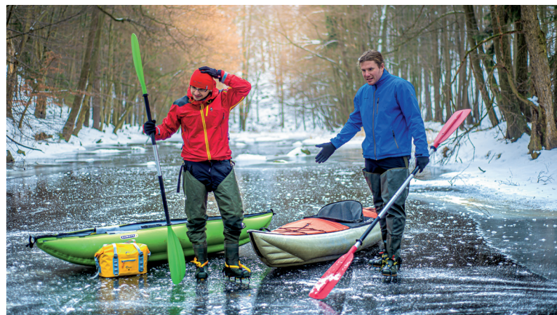
VLEVO: RUSKÉ LEDOVCOVÉ JEZERO FROLICHA, ZHRUBA OSM KILOMETRŮ VEDLE BAJKALU. VELMI DLOUHO TO PRO NÁS VŠECHNY BYLO NEJODLEHLEJŠÍ MÍSTO, KDE JSME SE KDY VYSYTLI. ROK 2010. VPRAVO: NA ŘECE CHRUDIMCE V NEPŘÍLŠ VHDNÝ VODÁCKÝ MOMENT. ROK 2017.

mi daly do vínku chuť pádlovat a bejt mokrej. Když to tehdy táta viděl, jak jsem z toho plavidla hotovej, k šestým narozeninám mi koupil jeden z nejlepších dárků mého života. Můj vlastní nafukovací člun Barum! Co jsme se v něm na Hlubáku najezdili! Dokonce jsem v něm doma dobře půl roku spal, dokud jsem se do něj pohodlně vešel a nemusel se potupně vrátit do postele. Člun pak představoval mojí hlavní představu o vodáctví po celou střední školu a mimochodem, slouží u nás na chatičce dodnes.