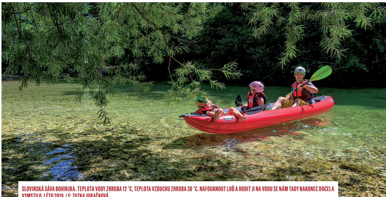
SLOVINSKÁ SÁVA BOHINJKA. TEPLOTA VODY ZHRUBA 12 °C, TEPLOTA VZDUCHU ZHRUBA 30 °C. NAFOUKNOUT LOŤ A HODIT JI NA VODU SE NÁM TADY NAKONEC DOCELA VYMSTILO. LÉTO 2019.

Hlavní výhodou nafukovací lodi, jak jsem pochopil, není ani tak její stabilita, jako skladnost. A ta se pro mě, co by člověka neustále někam cestujícího, stala tou asi nejpodstatnější. Jednomístného Twista i Swinga jsme nejednou vezli vlakem na zádech, ale co třeba nová „trojčlovčí“ Thaya? Když jsem ji poprvé viděl nafouknutou, nevěřil jsem, že bych s ní mohl cestovat tak, jak jsem zvyklý. Ale dcerunky se nechaly slyšet, že by na menší povyražení na nové lodi se mnou vyrazily rády, pokud bude po cestě zmrzlina. Venku bylo hezky, pomalu končilo jaro, čtvrtá hodina odpolední a v hlavě se mi bleskurychle zrodil bláznivý plán. Ani ne za půl hodiny jsme já i obě moje holky už seděli v autobuse z Pardubic do