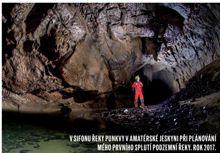
V SIFONU ŘEKY PUNKVY V AMATÉRSKÉ JESKYNI PŘI PLÁNOVÁNÍ MÉHO PRVNÍHO SPLUTÍ PODZEMNÍ ŘEKY. ROK 2017.

Asi tak o měsíc později jsme už balili do našeho milovaného Slovinska k Bohinjskému jezeru a mně bylo jasné, že Thayu nemůžu nechat doma. Našla čestné místo v kufříku naší oktávky a pak i před stanem na břehu jezera, po kterém s námi křižovala jako remorkér. Jinak poklidnou hladinu ledovcového jezera se mnou čeřila za úsvitu, uprostřed mlh a ještě dřív, než vstali lidi v kempu a postupně zaplnili hladinu na paddleboardech. Tou dobou jsme už i s holkama drandili, jen jsme za člun zapřáhli menší nafukovačku a hráli si na černé pasažéry. Když nás tam viděla kroužit moje žena, rozhodla se dát